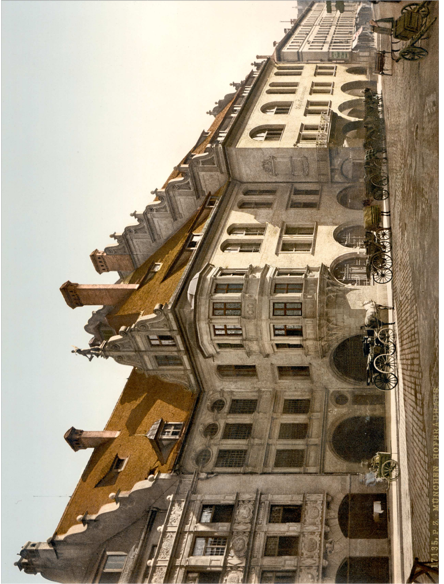
17135. P. Z. - MÜNCHEN. HOEBRADHAUS.